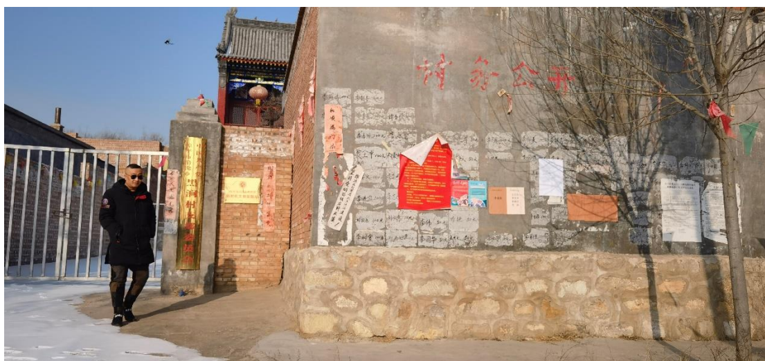
图 6 黑涧村公示