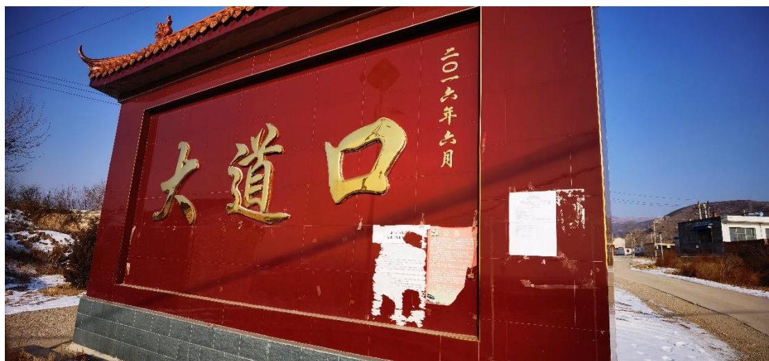
图 5 大道口村公示

于 2020 年 6 月 22 日~2020 年 7 月 6 日，在柏家庄、红花沟及羊圈村张贴了告示；张贴区域、时间符合生态环境部令第 4 号《环境影响评价公众参与办法》。张贴的公示照片见图 5~图 7。